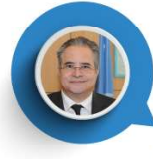
الدكتور طارق الشيخ ممثل الأمين العام للأمم المتحدة المندوب المقيم لدى دولة الكويت