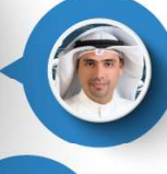
السيد مفرح المنيف رئيس الصندوق الوطني للتنمية المشاريع الصغيرة والمتوسطة