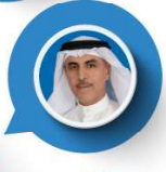
السيد بدر السبيعي الرئيس التنفيذي للشركة الكويتية للاستثمار